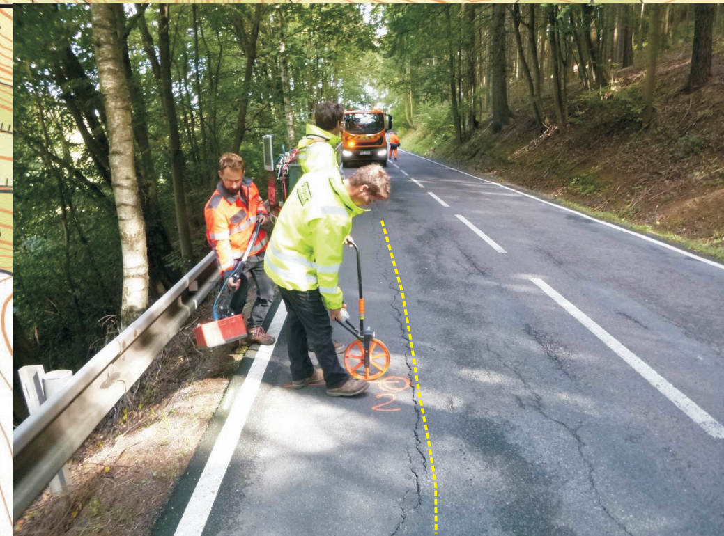
Geofyzikální měření v místě vrtu V-2 a podélné trhliny ve vozovce silnice

Zpracoval: Ing. Petera Datum: 26.10.2019